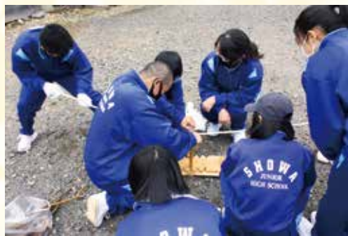
1年野外学習(火おこし)

新型コロナウイルス感染症対策をしながら、「何ができるか」「どうしたらできるか」を考えて行事も行っています。