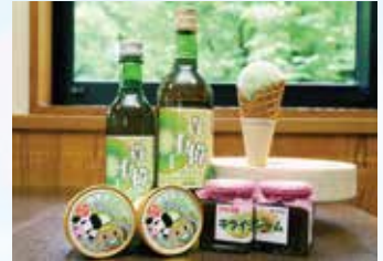
▲特産のキウイを使った製品

レストランでは午前8時から11時まで、ドリンク代のみでモーニングを用意。手作りの卵のフィリングがたっぷり入った温かいパンに、心が和みます。ランチタイムは午前11時から午後2時半まで。ボリュームたっぷりでお値打ちな「みそカツ定食」や「ソースかつ定食」が好評。他にも麺類や丼物、各種定食までさまざま。緑あふれる風景を眺めながら、食事を満喫できます。明宝フランクフルトやホットドック、カレーライス、牛丼、牛カルビ丼などテイクアウトできるメニューもあり、予約も可能。気軽に活用したい道の駅です。