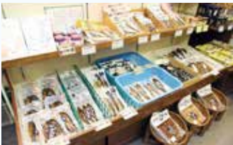
▲鮎の味わいも豊富にそろ