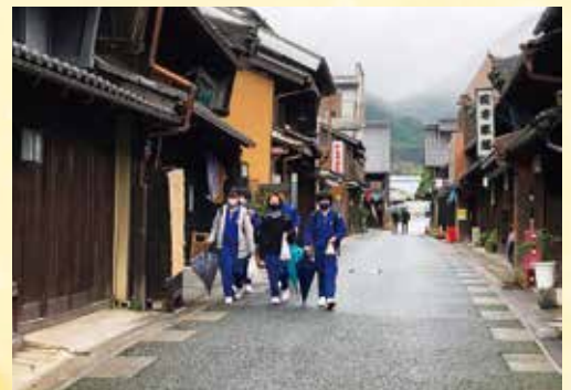
美濃町ウォークラリー

昨年度、一人一台のタブレットが市内小中学校に配備されました。iPadを利用した学習に取り組み始めました。