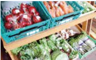
▲地域で収穫された新鮮野菜