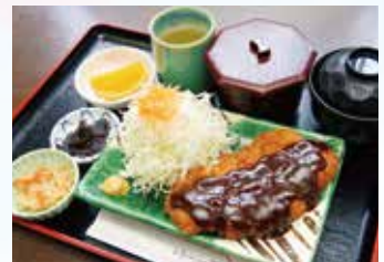
▲好評な「みそかつ定食」