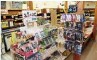
▲多彩な商品が並ぶ物産館