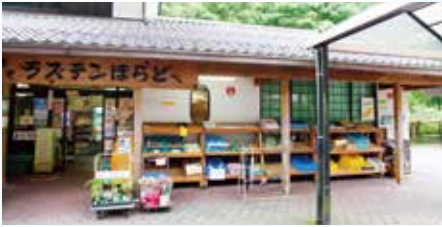
▲木立に囲まれた道の駅

住所 関市洞戸菅谷545 TEL 0585-52-2020 HP https://sekikanko.jp/spot_post/315 営業時間 8:00～17:00(12月～3月は16:00まで) (レストラン)8:00～16:00(12月～3月は15:00まで。OSはいずれも閉店30分前) 定休日 12/31～1/3、12月～3月の木曜 アクセス 東海環状自動車道・関広見ICから国道418号線、同256号線を北西へ約16km