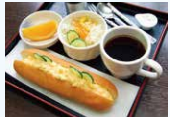
▲モーニングはドリンク代のみ