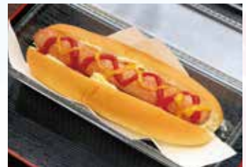
▲明宝フランクのホットドック