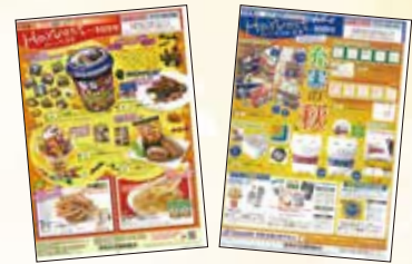
上記チラシは初回回覧用のチラシです。内容は変更になる場合があります。ご了承ください。