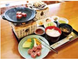
▲飛騨牛コロステーキ御膳と朴葉みそ単品