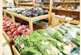
▲新鮮な野菜や加工品が並ぶ直売所

飛騨の特産品が多数そろったお土産コーナーで人気を集めるのは、「ななもり清見」オリジナル商品。国産の大豆と飛騨産コメこうじ、粗塩だけで作った「手造りこうじみそ」、厳寒で知られる庄川町六蔵(むまや)で干した「厳寒干し大根」、レトルトパウチの「牛すじカレー」、うま味たっぷりの「焼肉のたれ」など。飛騨の自然と人々が育んだ魅力を満喫し、自身が味わったおいしさをお土産にもできる道の駅です。