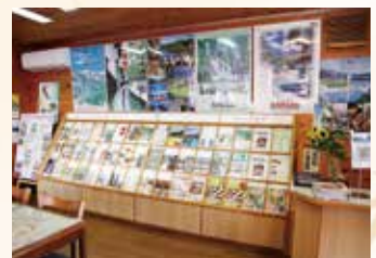
▲情報コーナーには観光パンフレットが充実