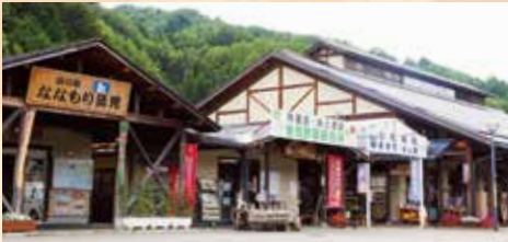
▲飛騨の森の息遣いを感じる道の駅

住所 高山市清見町牧ヶ洞2145 TEL 0577-68-0022 アクセス 中部縦貫自動車道・高山西IC出入口の向かい側。国道158号線沿い 営業時間 野菜直売所 8:00～17:00(11/16～3月は9:00～16:00、4月は9:00～17:00) 定休日 無休 HP http://www.nanamori.jp/ 売店 9:00～17:00(11/16～3月は16:30まで) レストラン 11:00～15:30(営業時間短縮中。土日祝は時季により17:00、または16:00まで。ラストオーダーは終了30分前)