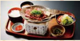
▲飛騨牛朴葉みそ焼肉御膳