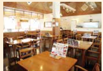
▲換気よく広々としたレストラン