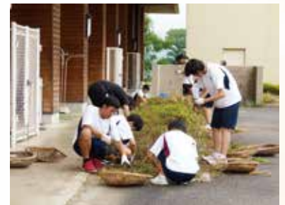
ボランティア清掃