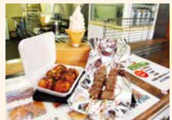
▲おみそれソフト、飛騨牛入りたこ焼き、飛騨牛串焼き