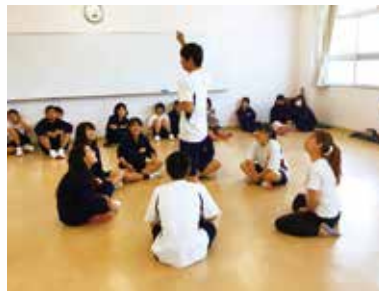
演劇ワークショップ