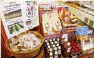
▲人気を集める「ななもり清見」オリジナル商品