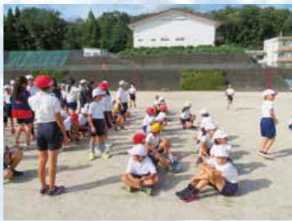
カ 自分で健康・安全 事前予告なしに行った命を守る訓練では、先生がいなくても高学年が低学年を指示して並ばせるなど、考えて行動しました。