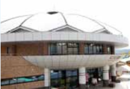
▲どんぶり型にデザインされた建物

住所 土岐市肥田町肥田286-15 TEL 0572-59-5611 営業時間 9:00～17:45(冬季は17:00まで) HP http://www.donburi-kaikan.com 定休日 火曜・12/30～1/1 アクセス 東海環状自動車道・土岐南多治見ICから県道661号線経由で約9km