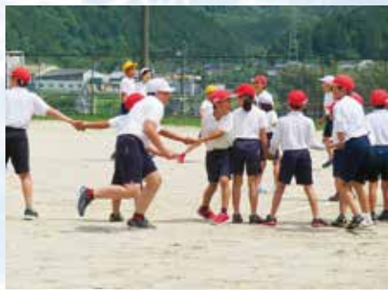
オ 元気な外遊び 子供たちは外で遊ぶのが大好きです。ロング昼休みには、運動委員が企画した遊びで全校が元気に仲良く遊びます。