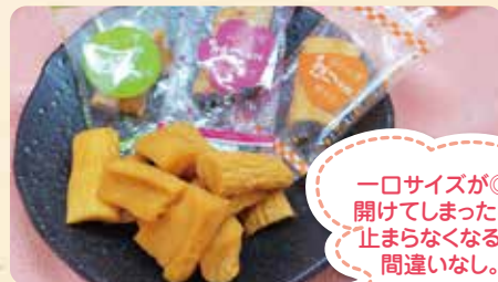
ZENTAの金のポターージュ 規格:18.7g×12袋 賞味期限:365日