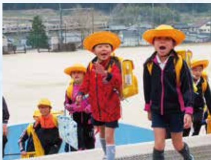
ウ 笑顔のあいさつ 毎朝、児童玄関前では「おはようございます。」という明るい元気なあいさつの声が響いています。