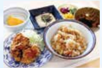
▲窯職人にちなんだ「窯暮らし定食」