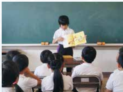
イ いつでも読書 読書の時間を子供たちは楽しみにしています。図書委員、母親、先生方の読み聞かせも行っています。