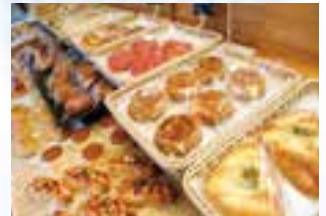
▲焼き立てのパンの芳しい香りが漂う