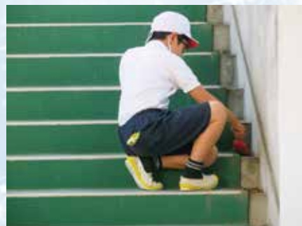
エ ピカピカ掃除 学校をピカピカにしようと、一人でも黙々と掃除に取り組みます。