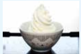
▲直径12cmの井に入ったソフトクリーム