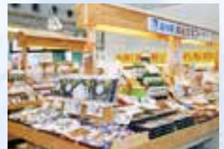
▲全国の道の駅の逸品がそろう