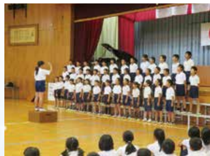
ア 堂々発表 集会ではいろいろな発表があります。委員会や主張大会の発表、合唱の発表など、子供たちが堂々と発表しています。

釜戸小学校には、学校の教育目標を子供たちのためあてとして具体化した「6つの宝」があります。それは、「堂々発表 ・いつでも読書 ・笑顔のあいさつ ・ピカピカ掃除 ・元気な外遊び ・自分で健康・安全」です。今年度は、「広げよう かがやく6つの宝」を児童会のスローガンに掲げました。今よりもっといい自分、いい釜戸小になるよう、日々、がんばって6つの宝を磨いています。