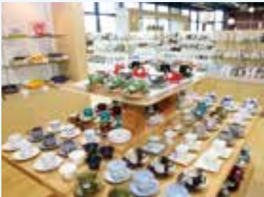
▲多彩な美濃焼を産地価格で提供