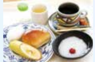
▲ボリュームたっぷりのモーニング

同館では毎月第1土曜の午後2～4時、じゃんけんを買ったらどんぶりソフトクリームを無料にするなど、趣向を凝らしたイベントも開催。美濃焼から、さまざまな楽しみが広がっています。