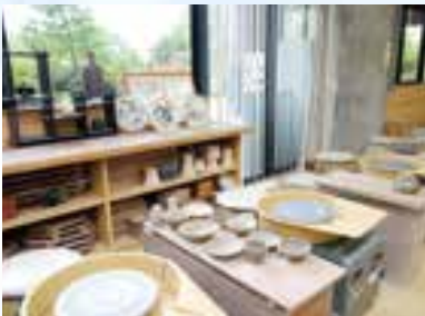
▲電動ろくろも体験できる陶芸教室