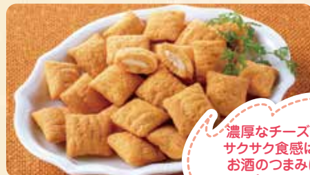
まるごともっちりも 規格:80g 賞味期限:120日