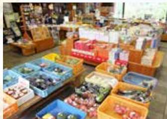
▲農産物や加工品など地元特産品が並ぶ

清流・小坂川のほとりにたたずむ「南飛騨小坂はなもも」。岐阜の宝第1号に認定された「小坂の滝めぐり」や、飛騨小坂温泉郷の玄関口でもある道の駅です。