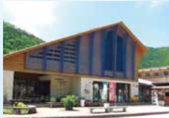
▲自然に抱かれたコテージ風の建物

住所 下呂市小坂町赤沼田811-1 TEL 0576-62-1010 営業時間 売店 8:00～16:00(11月～3月は15:30まで)・喫茶 8:00～15:00(11月～3月は14:30まで) HP https://hida-osaka.jp/cominfo.html?an=hanamomo 定休日 無休 アクセス 東海環状自動車道・美濃加茂ICから国道41号線、県道437号線(飛騨御岳はなもも街道)経由で約87km