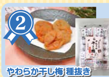
やわらか干し梅 種抜き