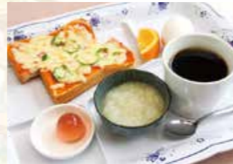
▲飲み物代のみでおいしいモーニング