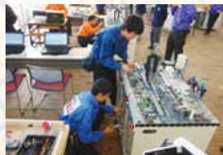
ものづくりコンテスト=メカトロニクス部門= (電子機械科)