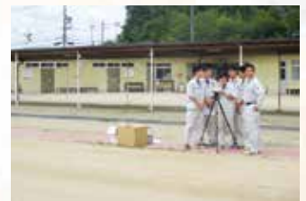
ドローン測量 (建設工学科)

・ 相互に多様性を理解し、積極的に海外校や特別支援校と交流する活動を積み重ねています。