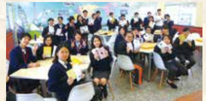
台湾・景文高校との学校間交流活動