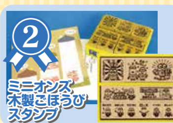
ミニオンズ 木製まほうび スタンプ