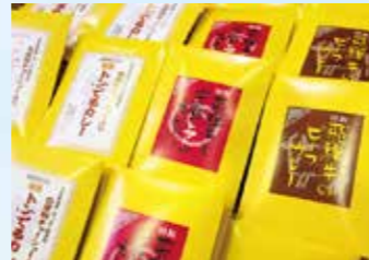
▲道の駅のオリジナルカレーは3種類