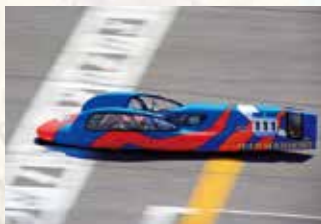
エコランカー大会 (機械科)