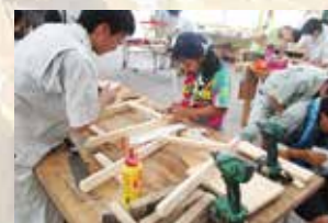
わくわくものづくり広場

・ 模擬株式会社「Seki Shoko Company」を立ち上げ、工業・商業の専門的な知識や技能を生かして、全校を挙げて地域貢献活動に取り組んでいます。