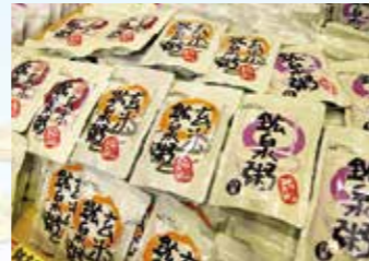
▲炭酸泉でコシヒカリを炊いた「鉱泉粥」