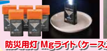
防災用灯 Mglライト(ケース入)