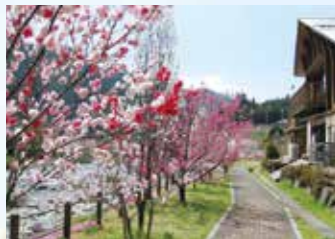
▲春にはハナモモが美しく咲き誇る