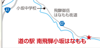
道の駅 南飛騨小坂はなもも

秋には周辺が美しく紅葉。春には川沿いのハナモモが赤、白、ピンクと華やかに咲き誇り、多くの来訪者でにぎわいます。四季折々の楽しみあふれる道の駅です。