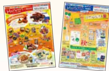
上記チラシは初回閲覧用のチラシです。内容は変更になる場合があります。ご了承ください。