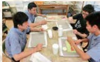
関特別支援学校との共同学習(藍染、陶芸授業)