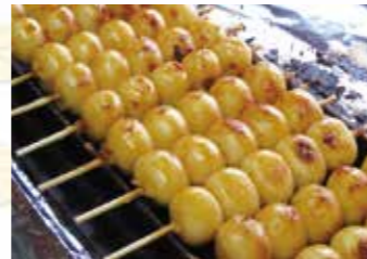
▲しょうゆが香ばしい「みだらし団子」