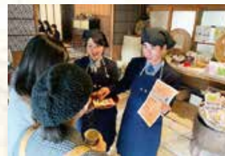
古民家カフェ協働運営 (総合ビジネス科)