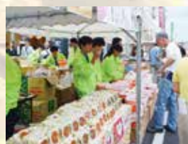
刃物まつり出店販売