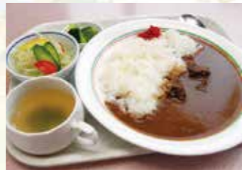
▲カレーにはサラダとスープが付く

近年はサッカー女子日本代表チーム名として有名ですが、ナデシコは日本人が昔から愛してきた花。万葉集や枕草子にも登場し、秋の七草にも入っています。「撫でし子」が名前の由来と言われ、撫でたくなるほど可憐。清楚な美しさを女性に重ねて日本女性を表すようになったという説もあります。大和撫子のイメージは時代遅れの感がありますが、植物としてのナデシコは意外と強く、場所を選ばず育つ多年草。古くから世界各地に分布し、種類豊富で、カーネーションもナデシコから改良されたものです。か弱そうに見えて、実はたくましく、さまざまに進化・発展している姿は、現代の日本女性にもびったりかもしれません。