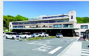
長良医療センター