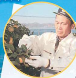
瀬戸田町レモン生産者

「エコレモン」とは減農薬栽培で 防菌剤やワックスを使用して いないブランドレモンです。