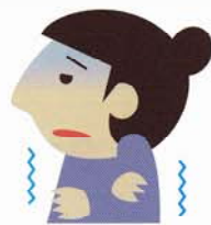
低血圧・ 冷え性の方