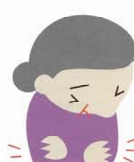
ひじ・ひざの痛み