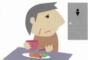
トイレの回数 が多い・便秘がち