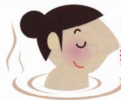
温泉気分で 眠りたい方