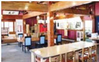
▲老田屋製麺所飛騨古川店