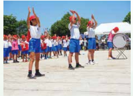
晴天に恵まれた運動会