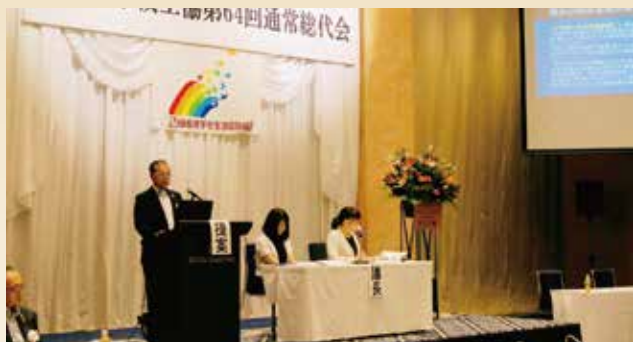
本年度の役員さん よろしくお願ひします。(敬称略)