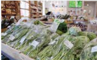
▲農家から届く新鮮な野菜