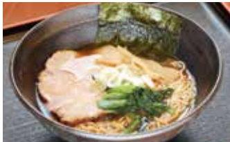
▲老田屋製麺所の特製中華そば