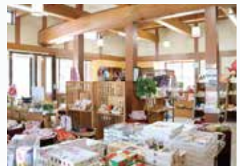
▲寄合所耕飛騨古川SHOP