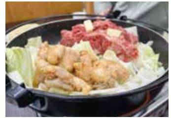
▲寄合所耕飛騨古川食堂のけいちゃん