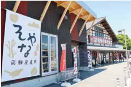
▲いくつもの店舗が並ぶ道の駅

飛騨古川食堂 12:00～14:30(L.O.14:30) 17:00～20:00(L.O.17:30)水木曜休