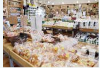
▲店長こだわりの逸品がそろう

レトロな雰囲気漂う「老田屋製麺所飛騨古川店」は、創業100年以上の老田屋製麺所がプロデュース。細縮れ麺にまるやかなスープ、肉厚で大きなチャーシュー入りのラーメンを、しょうゆ、みそ、塩、坦々の4種類から選べます。唐揚げグランプリで何度も受賞している沖縄の唐揚げのレシピを採用した「ケンティの唐揚げ」も人気。「寄合所耕(こう)」には、さるぼぼなど飛騨ならではの土産がそろった「飛騨古川SHOP」と、郷土料理とんちゃんやけいちゃん、豚ハラミ、ケンティの唐揚げが味わえる「飛騨古川食堂」が。食堂では今後、焼肉メニューも用意する予定。おいしさも楽しさも増えていく道の駅です。