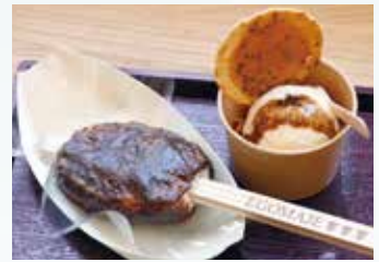
▲えごま工房の五平餅とアイスクリーム