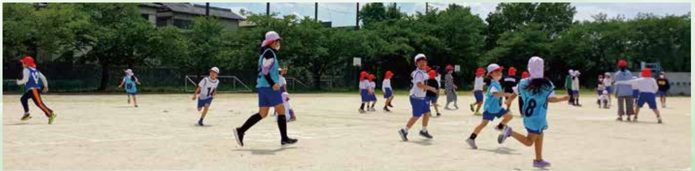
全校児童が縦割りグループで遊ぶ「なかよしあそび」の時間を月に2回設けています