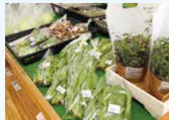
▲農家から新鮮な野菜や生花が届く