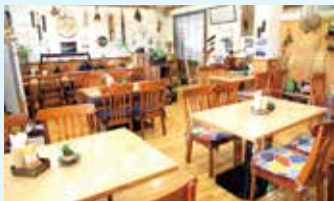
▲レトロでしゃれた内装の喫茶店