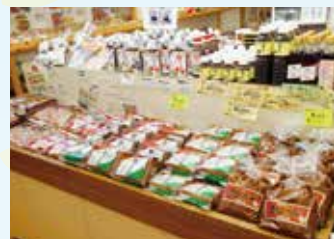
▲地元の蔵元が作るみそやしょうゆ