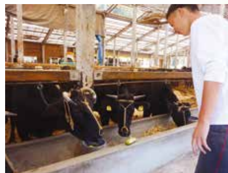
職場体験学習 飛騨牛舎で