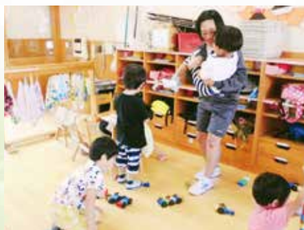
異年齢交流 園児と