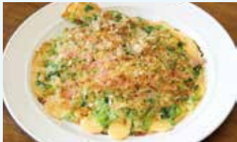
▲素朴な味わいの「ネギ焼き」