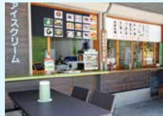
▲軽食がそろう「おかあちゃんの店」

観光案内所横のテナントスペース「おかあちゃんの店」では、2店が軽食を販売。「ひだまり」では飛騨牛コロッケ、揚げ餅、団子、たこ焼き、うどん、カツカレーなど。郡上産の「えごま」をふんだんに使ったえごま団子は、見逃せないおいしさです。ふっくらした厚焼き卵サンドも人気上昇中とか。「川上屋」ではラーメンやお好み焼き、たい焼きなど。自家製チャーシューや素朴なネギ焼きの味わいが、ツーリングの途中で立ち寄るライダーをはじめ、多くのファンに支持されています。心も体も安らぐ道の駅です。