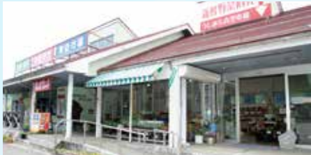
▲高原ルートの入り口にある道の駅