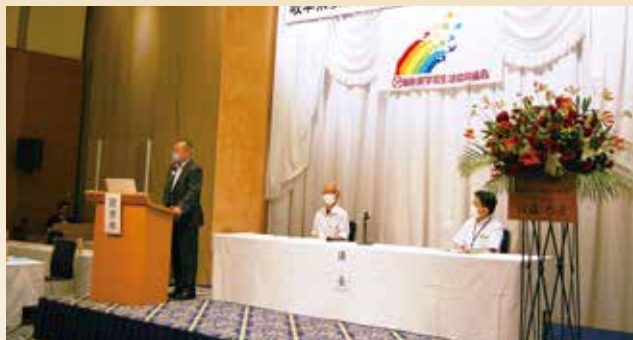
本年度の役員さん よろしくお願ひします。