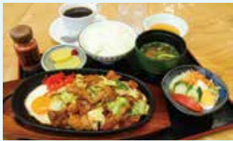
▲名物の「奥美濃ケイちゃん定食」