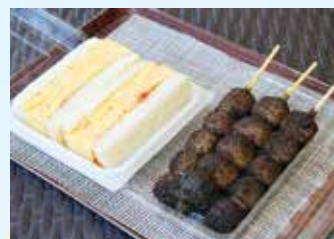
▲「厚焼き卵サンド」と「えごま団子」