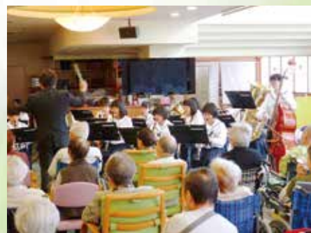
老人ホームでの吹奏楽部演奏