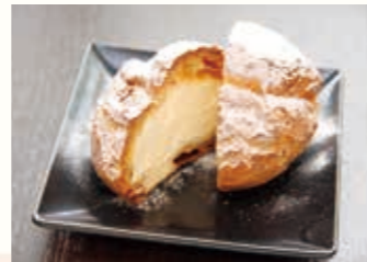
▲「みのぼんば」の絶品シュークリーム