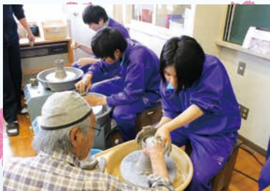
【三年生:東濃地区の地場産業でもある陶芸】