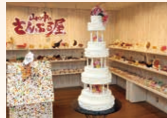
▲遊び心あふれる食品サンプル