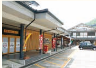
▲充実した施設が自慢の道の駅

住所 郡上市白鳥町向小駄良693-2 TEL 0575-82-3129 営業時間 8:30～18:00 HP http://okumino-shirotori.com 定休日 火曜日、12月31日、1月1日 アクセス 東海北陸道・白鳥ICから約4km、国道156号線沿い