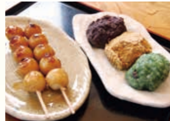
▲テイクアウトも地元産の素材