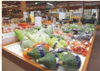
▲野菜やコメ、木製品が並ぶ「木遊館」