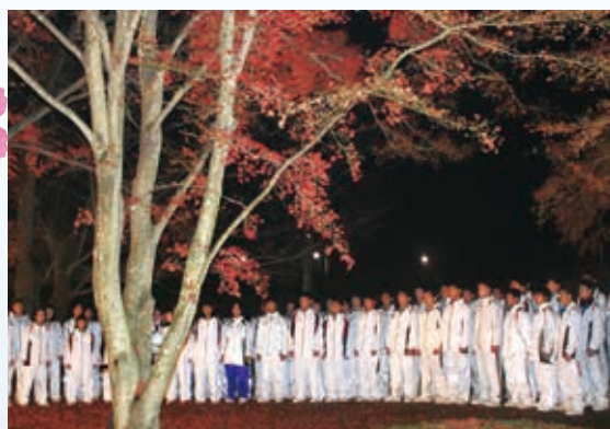
【曾木公園もみじライトアップ 全校合唱】

こうした学習の成果もあり、生徒たちは登下校時に地域の人々と明るく挨拶をしたり、公民館主催の行事や曾木町で行われる『曾木公園もみじライトアップ』などのボランティア活動に積極的に参加したりしています。年々人口が減少し、さみしくなる町を支えるのは産業や交通ではなく、「人」であると思える中学校です。