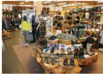
▲アウトドアショップ「HOOD」