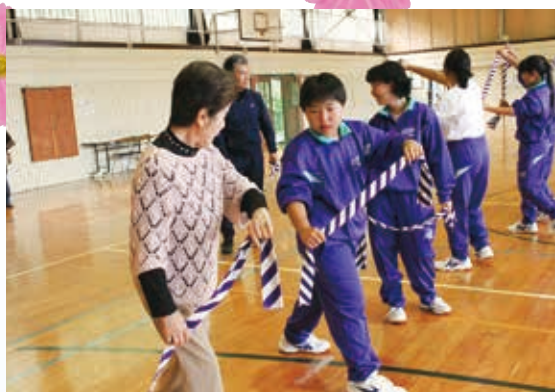
【一年生:中馬馬子唄踊り】