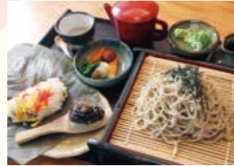
▲そば田楽、そばムースも味わえる「延年御膳」

広々とした物産センター1階では、郡上みそや地酒、鶏(けい)ちゃんなど、地元の特産品などをそろえ、奥ではスイーツとカフェ「みのぼんば」が営業。通販サイトで注目を集める同店のシュークリームは、濃厚なのに後味さっぱり、噂に違わぬ逸品です。モーニングやランチも好評で、ランチタイムには追加でスイーツバイキングが堪能できます。2階には食品サンプル工房「山の中のさんがる屋」があり、精巧な食品サンプルは遊び心あふれるお土産にぴったり。工房の見学や、予約で体験も可能。ミニスイーツから豪華なパフェまで作れます。巡っているうちに、終日のんびり過ごしたくなる道の駅です。