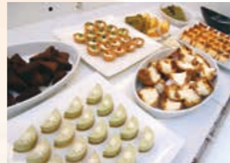
▲ランチタイムに追加できるスイーツバイキング