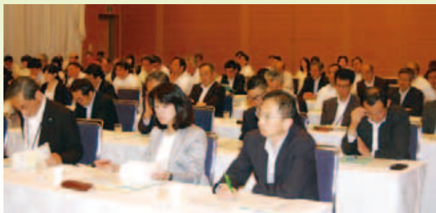
本年度の役員さん よろしくお願ひします。