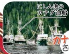
にしん漁のカナダ産船