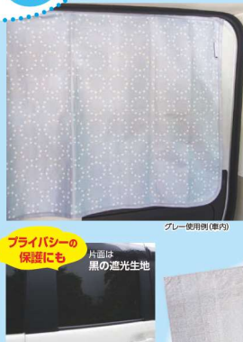
グレー使用例(車内)

対応車種 サイズ: 軽自動車・小型乗用車・コンパクトカーなど サイズM: 普通乗用車・ミニバンなど ※対応車種は必ずサイズを、サイズをすみご確認の上でご確認ください。