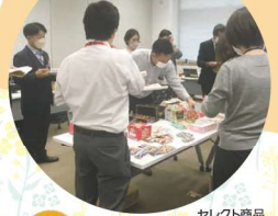
セレクト商品 選定会の様子