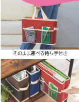
そのまま運べる持ち手付き 空きスペースを有効活用