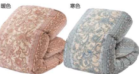
※写真の柄は一例です。写真以外の柄が縮く場合があります。

①①①(共通) ★サイズ約150×210cm★重量詰めもの約1kg★材質 表生地=ポリエステル100%★裏生地=ポリエステル90%フェザー10%★生産国 日本 ※素材の特性上、特有の臭いを感じる場合がございます。